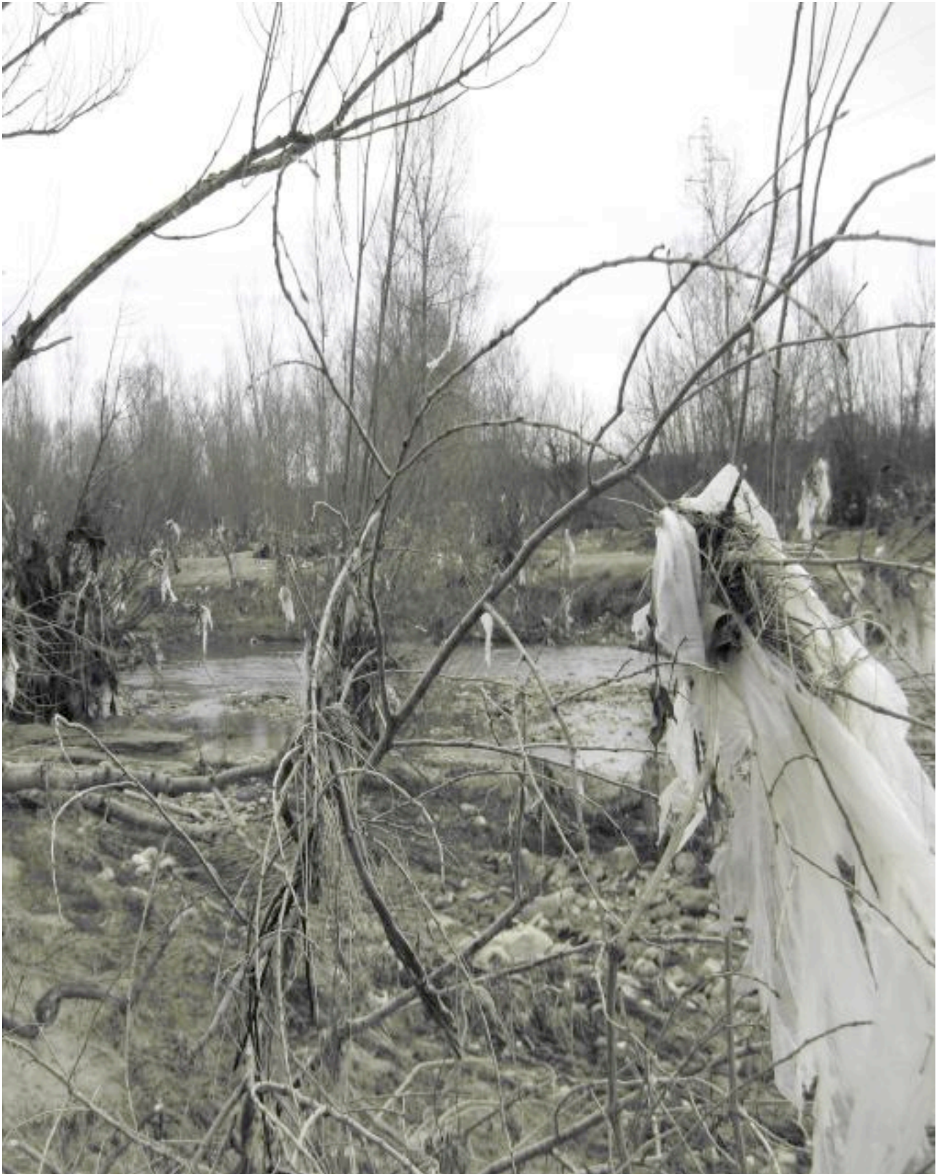
Le Calavon – Commune de Gault Janvier 2009